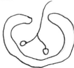
Felsenzeichnung, gefunden in Spanien Galizien